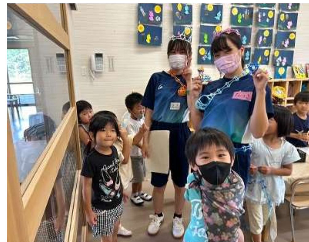
こども園の幼児との交流