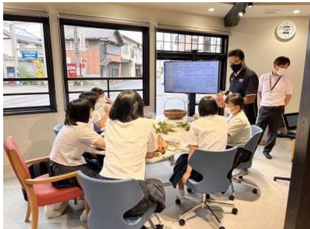
泉貨紙について学ぶ