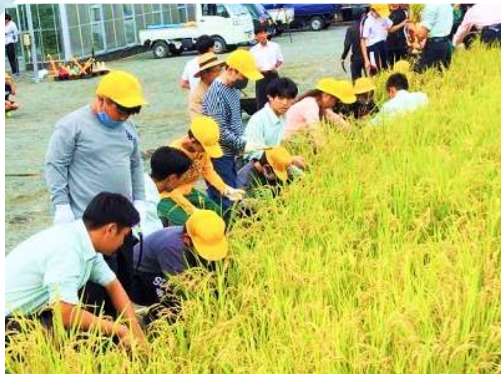
小学生との連携学習