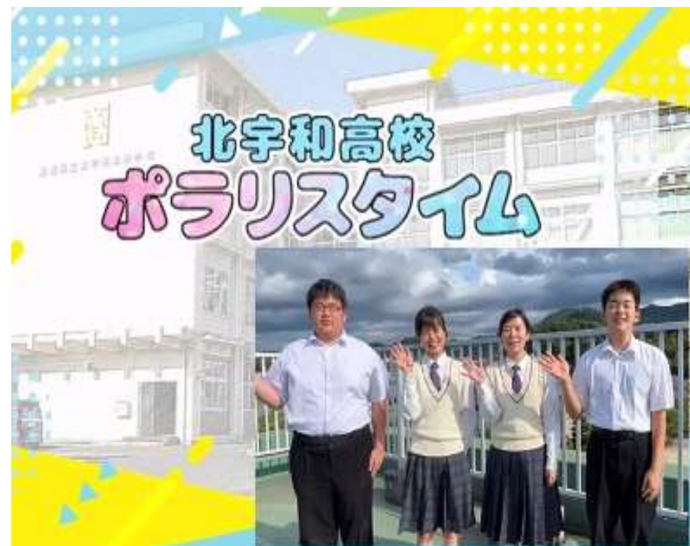
ケーブルテレビ番組制作