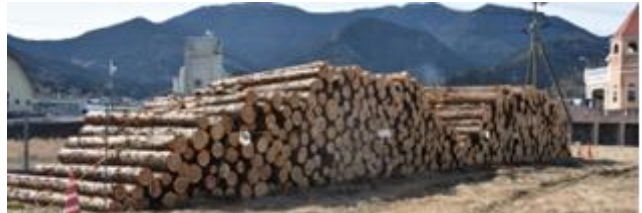
(教育寮の建材とした学校林の木材)

4年ぶりに同窓会総会が開催されました。28名の役員の皆様のご参加をいただき、上記の議案等に関して、熱心に御協議いただきました。また、多くの先輩方が大切に育てて頂いた学校林の木材を活用した教育寮が完成したことも大きな喜びとなりました。